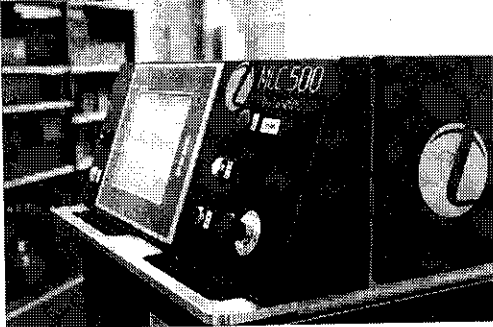
拡販していくゴム専用の射出成型用金型レーザー洗浄機

特長はタッチスクリーンで使い勝手が良く、化学添加剤不要で生産現場の環境にも配慮している。また、洗浄作業は事前にプログラムし、金型のCADファイル